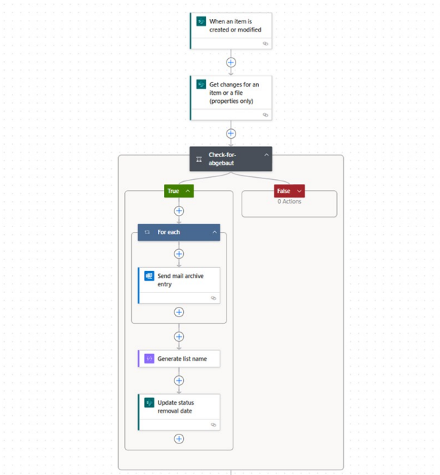
Workflow der automatischen Benachrichtigung