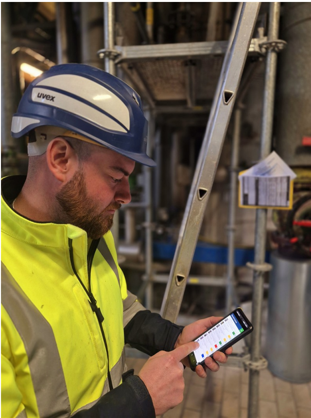
Bedienung der App durch einen Mitarbeiter